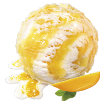
MANGO & CREAM