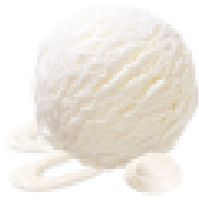
FIOR DI LATTE - SWISS CREAM