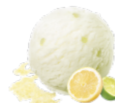
LEMON & LIME